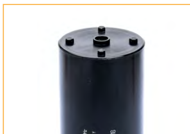
Tutti i condensatori della serie CME sono disponibili con fondo piatto All the CME series are available with flat case

Certificazioni: a richiesta UL su tutta la Serie CME. Certifications: UL for the whole CME series on request.