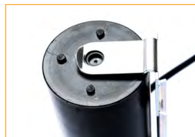
Staffa disponibile a richiesta per condensatori di altezza 85 e 111 mm Bracket available on request for 85 and 111 mm capacitors height