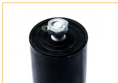
Codolo filettato M8 disponibile a richiesta nelle misure 38x85 e 46x85 M8 stud available on request for 38x85 And 46x85 capacitors